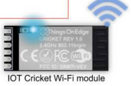
IOT Cricket Wi-Fi module

Vous pouvez maintenant commencer à configurer Cricket (voir la section CONFIG ) et le configurer pour envoyer des données aux appareils clients : smartphone, ordinateur portable, PC, ... Pour en savoir plus sur la façon de recevoir des données de Cricket sur les appareils clients, rendez-vous dans la section API de communication .