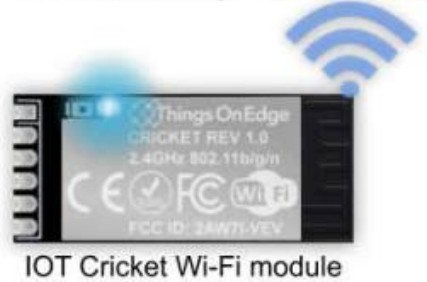
IOT Cricket Wi-Fi module