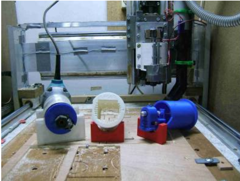
-3- détail de l'axe X