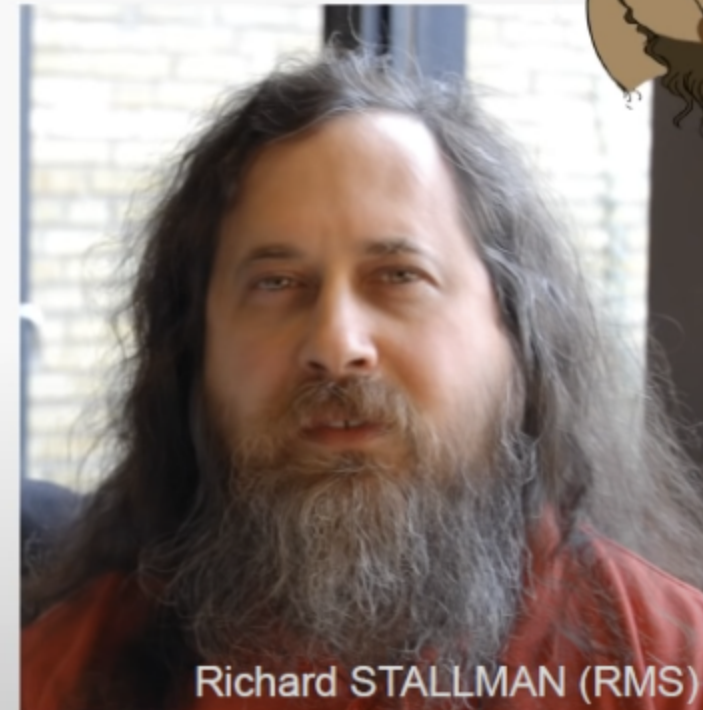
Richard STALLMAN (RMS)