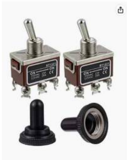
Passez la souris sur l'image pour zoomer