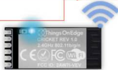
IOT Cricket Wi-Fi module