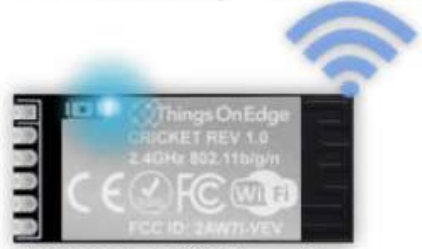
IOT Cricket Wi-Fi module