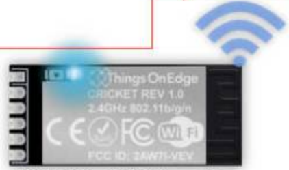
IOT Cricket Wi-Fi module