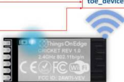
IOT Cricket Wi-Fi module

Vous pouvez maintenant commencer à configurer Cricket (voir la section CONFIG ) et le configurer pour envoyer des données aux appareils clients : smartphone, ordinateur portable, PC, ... Pour en savoir plus sur la façon de recevoir des données de Cricket sur les appareils clients, rendez-vous dans la section API de communication .