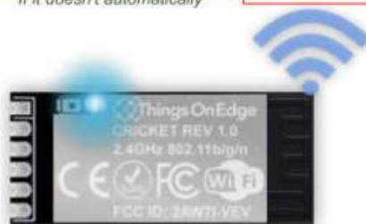
IOT Cricket Wi-Fi module