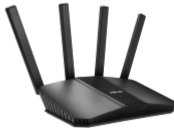
Routeur Wifi Asus RT BE58U

Le protocole de routage interne EIGRP (Enhanced Interior Gateway Routing Protocol) , principalement utilisé par les routeurs Cisco