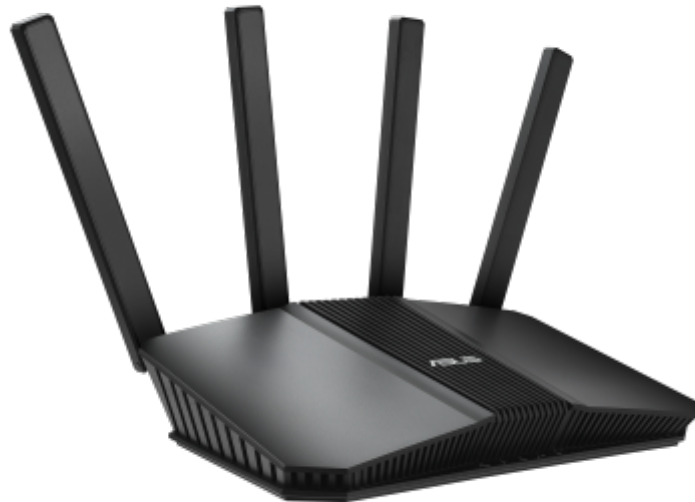
Routeur Wifi Asus RT BE58U

Le protocole de routage interne EIGRP (Enhanced Interior Gateway Routing Protocol) , principalement utilisé par les routeurs Cisco